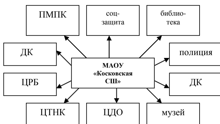
Рисунок 2: социальное партнерство